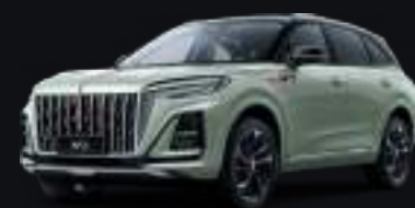
Светло-зеленый с чёрной крышей Light Green + black roof