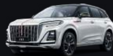
Белый с чёрной крышей White + black roof