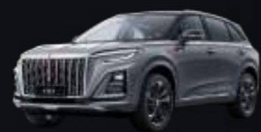
Серый с чёрной крышей Grey + black roof