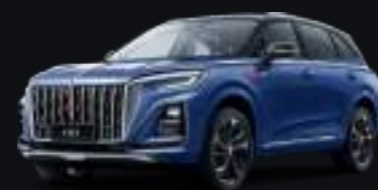
Синий с чёрной крышей Bamboo blue + black roof