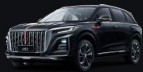
Чёрный Dark night